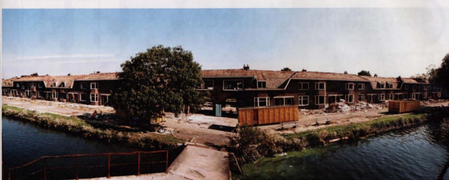
Renovatie van vissershop was duurder dan slopen en volledig herbouwen van het oude tuindorp aan de Zaan. Op de montagefoto links het bijna gesloopte Vissershop.