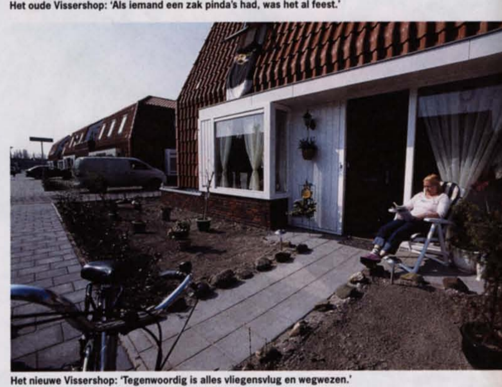
Het nieuwe Vissershop: 'Tegenwoordig is alles vliegenvlug en wegwezen.'