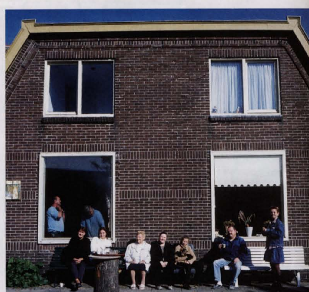
Het oude Vissershop: 'Als iemand een zak pinda's had, was het al feest.'

ente 2005. Ook het tweede deel van Vissershop ligt met de grond gelijk. In het nieuwe gedeelte, de helft aan de kant van de Zaan, worden de Vissershoppers die hun wijk niet willen verlaten. Zevenenzeventig Vissershoppers wonen al op hun oude plekke, en 25 wonen nog in een tijdelijke woning, wachtend tot de nieuwe woning is herbouwd, precies op de oude plek in de andere helft van het dorp, ergens volgend kalenderjaar. De nieuwbouw is iets ruimer dan de oude arbeiderswoningen, dus zijn er van de 244 huizen maar 216 overgebleven, en dat is nog inclusief het toreintje met appartementen, dat in het oude Vissershop niet stond, maar speciaal is gebouwd voor de ouderen, onder het motto: oud worden aan de Zaan. Zo'n veertig procent van de Vissershoppers keert terug. De rest is ergens anders gaan wonen. Zij die blijven, hebben eerste keus, dus de strook woningen aan de Notelaan, langs de Zaan, zijn allemaal bewoond. En dat voor een aangepaste huur van driehonderd, 350 euro. Zo'n twintig woningen worden aan nieuwkomers verhuurd. Die huur staat nog niet