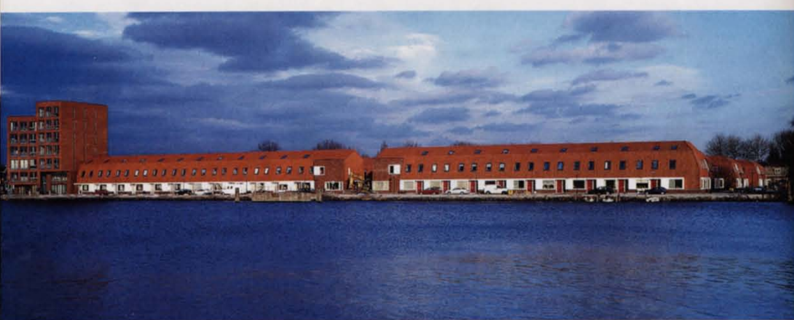
voorjaar 2003; rechts de nieuwbouw, dit voorjaar. Nee, het oude Vissershop krijg je nooit meer terug.