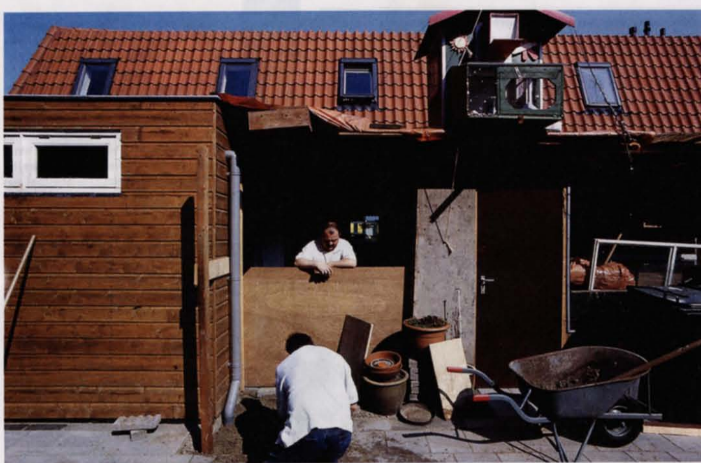
Verbouwen in het nieuwe Vissershop: niet meer allemaal hetzelfde heggetje.

Zo werd de ziel, die eerder nog in een symbolische dodenmars ten graven was gedragen, naar het nieuwe Vissershop gebracht. Een Vissershopper is nu eenmaal dol op symboliek.