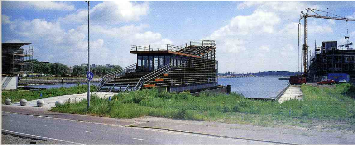
Janny Rodermond

In het grootschalige haven terrein, temidden van alle bouwactiviteiten, vormt de toegangsweg het houvast. Hieraan is een teken geplaatst, een stalen HE-profiel, met de naam New Deal, dat de aandacht van potentiële kopers moet vestigen op het enigszins terzijde geplaatste voorlichtingspaviljoen. De referentie aan Las Vegas, waar de strip haar identiteit ontleent aan het omringende spektakel, is zwak. Inventief is echter wel de wijze waarop met behulp van steigers en containers een elegant, multifunctioneel tijdelijk bouwwerk samengesteld is. Een simpele aaneenschakeling van twee lagen bouwcontainers bergt het kantoorprogramma. Het weghalen van een gedeelte van de vloeren schept ruimte voor een trappenhuis. Een monumentale trap van steigerdelen leidt naar de informatiebalie en expositieruimte. Op het dak wordt de trap gecontinueerd in een tribune, die uitzicht biedt op de bouwactiviteiten in het havengebied. Ook de zonwering is samengesteld uit steigerdelen, die ondanks hun grove karakter door hun belijning het paviljoen een sierlijk aanzien geven. Zodra het paviljoen overbodig geworden is kunnen steigers en containers elders in de bouw opnieuw gebruikt worden.